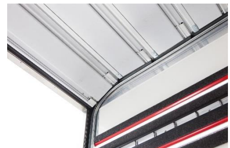
roleta aluminiowa podnoszona