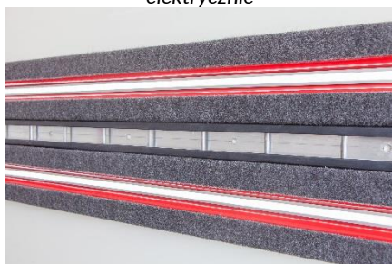
listwy mocowania boczne obite filcem