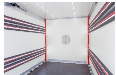
wielopunktowe oświetlenie LED