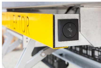
łatwo dostępny włącznik mechanizmu opuszczania schodów