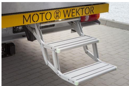
schody pantografowe otwierane elektrycznie

+ wielopunktowe oświetlenie LED – wewnątrz jest równomiernie oświetlone nawet jeśli jest mocno wypełnione dużymi towarami